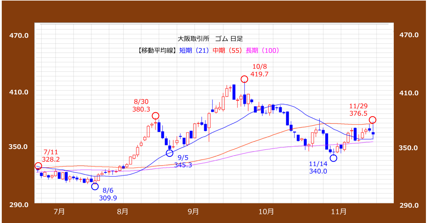
【出所】REFINITIVデータよりAIゴールド証券作成

大阪取引所 ゴム【逆張り方針】 【12/2~12/30】 * 予想レンジ 345.0円 ~ 386.0円 * 予想レンジは25年5月限の値段となります