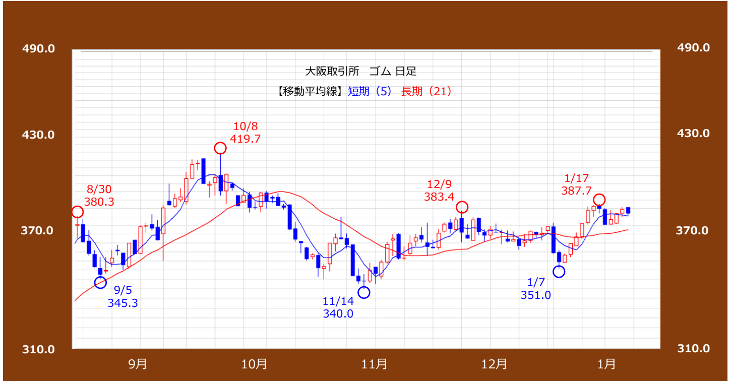
【出所】REFINITIVデータよりAIゴールド証券作成

大阪取引所 ゴム【逆張り方針】 【1/27~1/31】 * 予想レンジ 373.0円 ~ 388.0円 * 予想レンジは25年6月限の値段となります